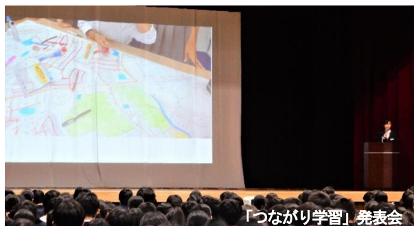
「つながり学習」発表会

もう一つの特徴は、「つながり学習」です。この学習では、地域の方々や地元の企業・大学との連携による学びが展開され、生徒が課題を見付け、解決し、解決した結果を発信するという生徒の主体的な学びが特徴となっています。発表の際には原稿を読むのではなく、内容をしっかりと自分のものにして、自分の言葉で話す伝統が今も受け継がれています。