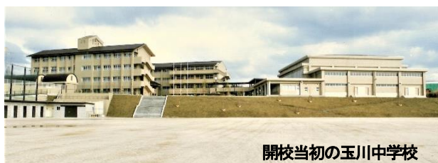
開校当初の玉川中学校

玉川中学校は、平成4年4月に開校した草津市内唯一の平成生まれの中学校で、今年度は創立30周年を迎えます。校長室には開校当初からの数々の写真がアルバムにまとめられており、それらを見ると30年の歴史がよく分かります。