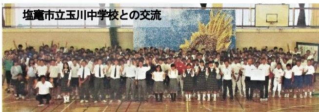
塩竈市立玉川中学校との交流

もう一つの特徴は、「つながり学習」です。この学習では、地域の方々や地元の企業・大学との連携による学びが展開され、生徒が課題を見付け、解決し、解決した結果を発信するという生徒の主体的な学びが特徴となっています。発表の際には原稿を読むのではなく、内容をしっかりと自分のものにして、自分の言葉で話す伝統が今も受け継がれています。